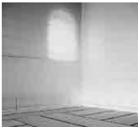
Meditationsraum im Zentrum Verkündigung

(*) Die Namen wurden von der Redaktion geändert